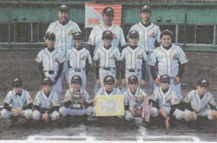
3位・穴川タイガース (稲毛区)